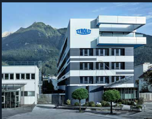
Le siège de TYROLIT à Schwaz, en Autriche.

Subscribe our channel youtube.com/TYROLITgroup